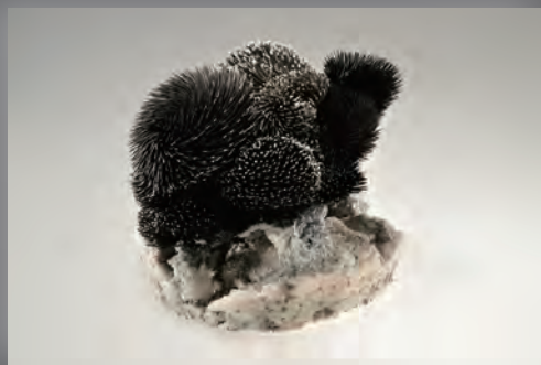
稲崎栄利子(雄鶏) 2005年 高松市美術館蔵