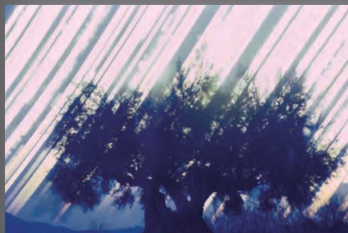
北野謙「光を集める」より 香川県土庄町小豆島1 2017年冬至～2018年夏至) 2017～18年