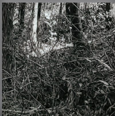
本田健「山あるきー四月(木下閣の草木)」2019年