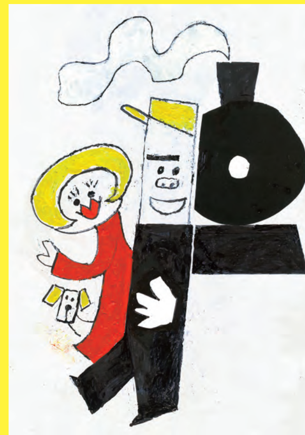
ジャーニー、ダイヤ、トランク (「ハッチボッチステーション」より) 2024年 ©Ryuji Fujieda