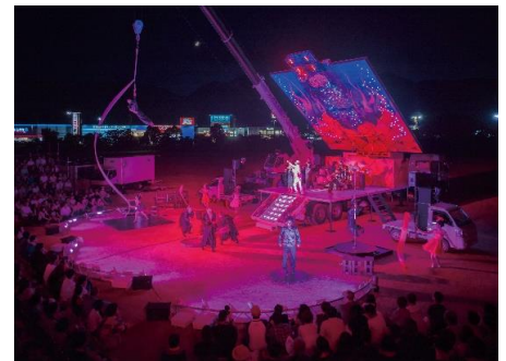
野外劇「日輪の翼」(原作:中上健次) 2016年