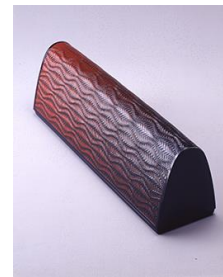
太田備《監胎箱 波文》1989年

漆芸の魅力を下支えする素地に注目し、多彩な手法が用いられた漆芸作品25点(10作家)を紹介します。漆で様々な図案や模様が施された表面とともに、その下地となる素材に注目して、讃岐漆芸の美と技術をお楽しみください。