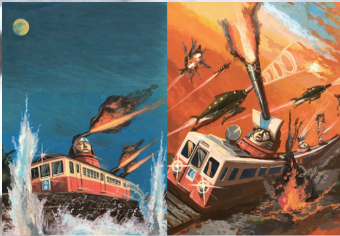
《コトディーン・ルート志度～神櫛王の脱出～前編・中編》2022年、2023年 作画：テッチ