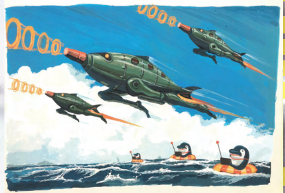
《コトディーン・ルート志度 前編》2022年 作画：テッチ