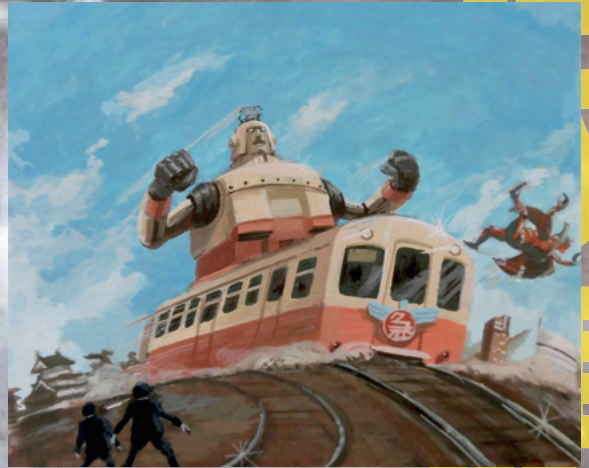
《コトディーンタイトル》2019年 作画：テッチ

『電磁車輛コトディーン』は、香川のアート・グループ「野口会館」が高松琴平電気鉄道と協力し、その沿線における歴史や風土をモチーフに創作した仮想郷土物語です。緻密に練り込まれた脚本と、様々なカルチャーに触発された芸術性の高いイラストレーションは美術の枠を越えて様々な分野で高い評価を受けています。展示では初公開となるコトディーンの様々な資料を通じて、その創作の秘密、楽しさの奥に広がる魅力的な世界観に迫る企画になっています。