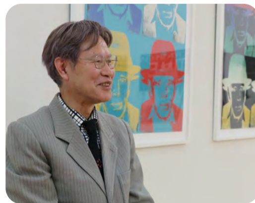
高松市美術館 アートアドバイザー

1950年香川県生まれ。 哲学者、詩人、美術評論家、京都大学 名誉教授、京都市立芸術大学客員教授。 専門は哲学・美学。 著書には『空海と日本思想』『差異の王国 美学講義』『まず美にたずねよ 風雅モダン へ』『あいだ哲学者は語る』など。 講演、シンポジウム、展覧会企画審査 など多数。