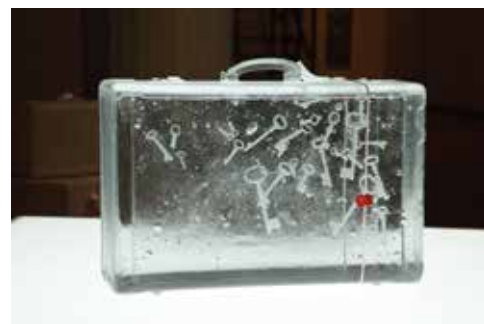
宮永愛子《suitcase-key》2013 写真:木奥恵三 ©MIYANAGA Aiko/Courtesy Mizuma Art Gallery