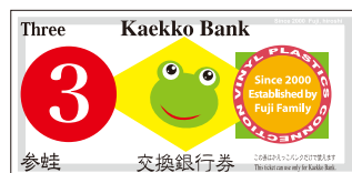
かえるポイント交換券

※お店に交換券が無くなったら配布を終了します。 ※お店によっては配布していない場合があります。