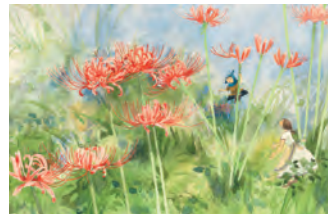
《野の花と小人たち ひがんばな》1976年