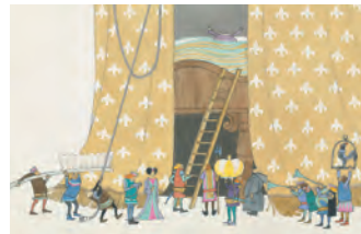
《おおきなもののすきなおうさま》1976年