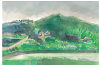
《王越村 (香川県坂出市王越町)》2015年