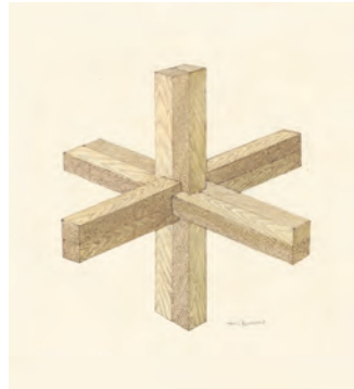
《組木細工 (空想工房の絵本)》2014年