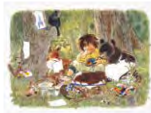
まほうのえのぐ (1993年) 林明子 作・絵 / 福音館書店刊