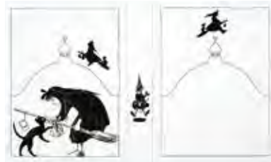
魔女の宅急便 (1985年) 角野栄子 作 / 林明子 絵 / 福音館書店刊