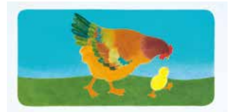
ひよこさん (2013年) 征矢清 作 / 林明子 絵 / 福音館書店刊