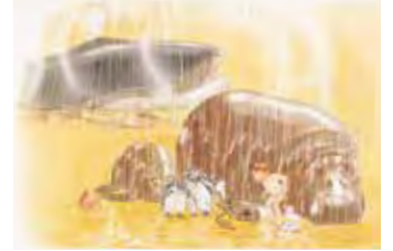
おふろだいすき (1982年) 松岡享子 作 / 林明子 絵 / 福音館書店刊