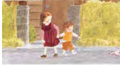
あさえとちいさいもうと (1979年) 筒井頼子 作 / 林明子 絵 / 福音館書店刊