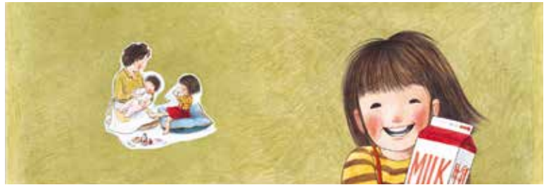
はじめてのおつかい (1976年) 筒井頼子 作 / 林明子 絵 / 福音館書店刊

絵本作家・林明子さんが1976年に初めて手がけた物語絵本「はじめてのおつかい」が誕生して2016年で40年が経ちました。この作品をきっかけに林さんは「こんとあき」「おつきさまこんばんは」「はじめてのキャンプ」など数々の名作を生み出してきました。子どもたちが見せるほんのわずかな心の揺らぎや、葉っぱ一枚一枚のみずみずしさまで優しく繊細に描き出した林さんの作品は、世代を超えて多くの人に愛されています。本展では林さんの代表作「はじめてのおつかい」「こんとあき」から最新作「ひよこさん」までの絵本原画のほか、林さんがイラストレーターとして活動していた時の貴重な作品や、角野栄子さん作「魔女の宅急便」に添えた挿絵など、約200点の原画や資料を展示します。林さんが描き出す表情豊かな絵本の世界をどうぞお楽しみ下さい。