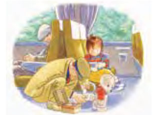
こんとあき (1989年) 林明子 作・絵 / 福音館書店刊