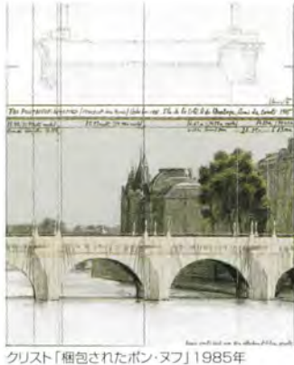
クリスト「梱包されたボンヌフ」1985年