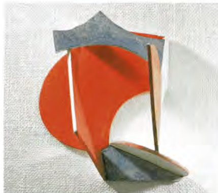
高橋乾二郎「あかさかみつけ」1981年