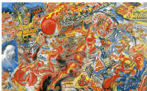
篠原有司男「亀とコニーアイランド」1981年