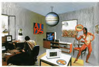
リチャード・ハミルトン「今日の家をこれほど違ったものにしてるのは、一体何か？」1994年