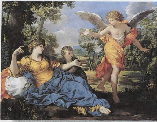
ピエトロ・ダ・コルトーナ 「ハガールとイシマエルの前に現れる天使」 1638年頃