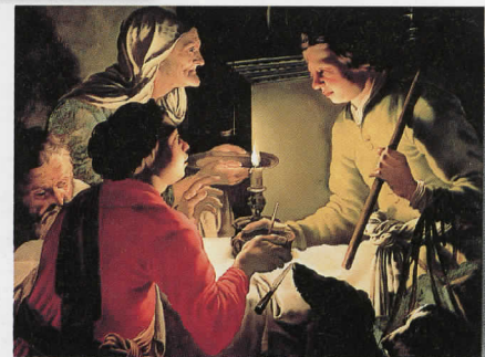
ヘンドリック・テルブリュッヘンの工房 「ヤコブに長子の権利を売るエサウ」1627年頃