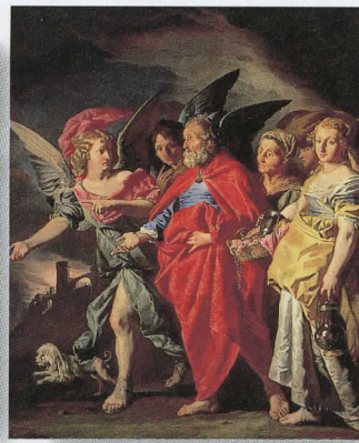
マティエ・ア・ストーム 「エルソムを去るロトとその家族」 1630年頃