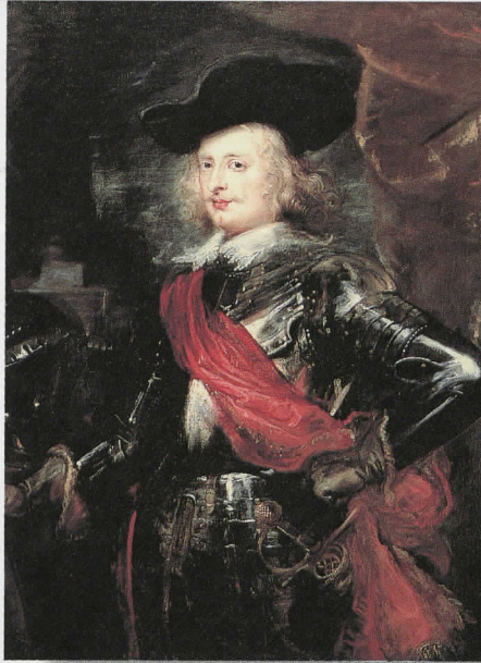
ピーテル・パウル・ルーベンス 「フェルディナント大公の肖像」1635年頃

ヨーロッパ文化の光と闇が織り成す、華麗なるバロック絵画の数々をお楽しみください。