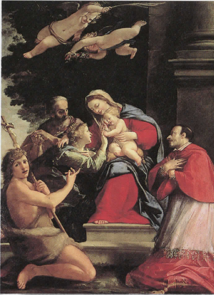
ジョヴァンニ・フランチェスコ・ロマネリ 「聖女カタリナ的神秘の結婚」1640年代初期(?)