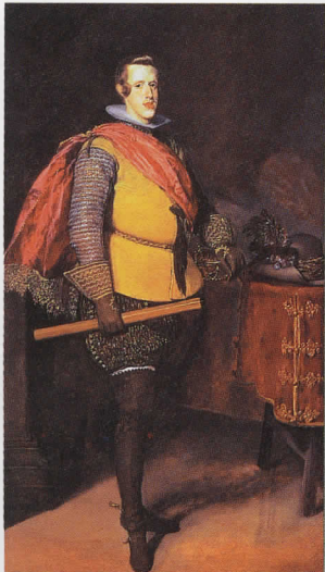
ディエゴ・デ・ベラスケス 「フェリペ4世の肖像」1628-31年頃