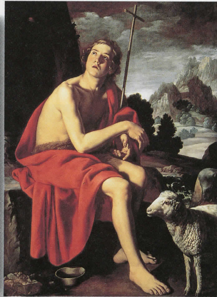
17世紀スペイン派「洗礼者聖ヨハネ」