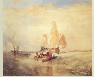
J. M. W.ターナー「次は画家の番（ロープ）乗船する旅客たち（カレーの海峡）」1827年