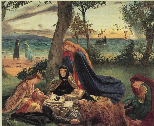
ジェームズ・アーチャー「アーサー王の死」1860年