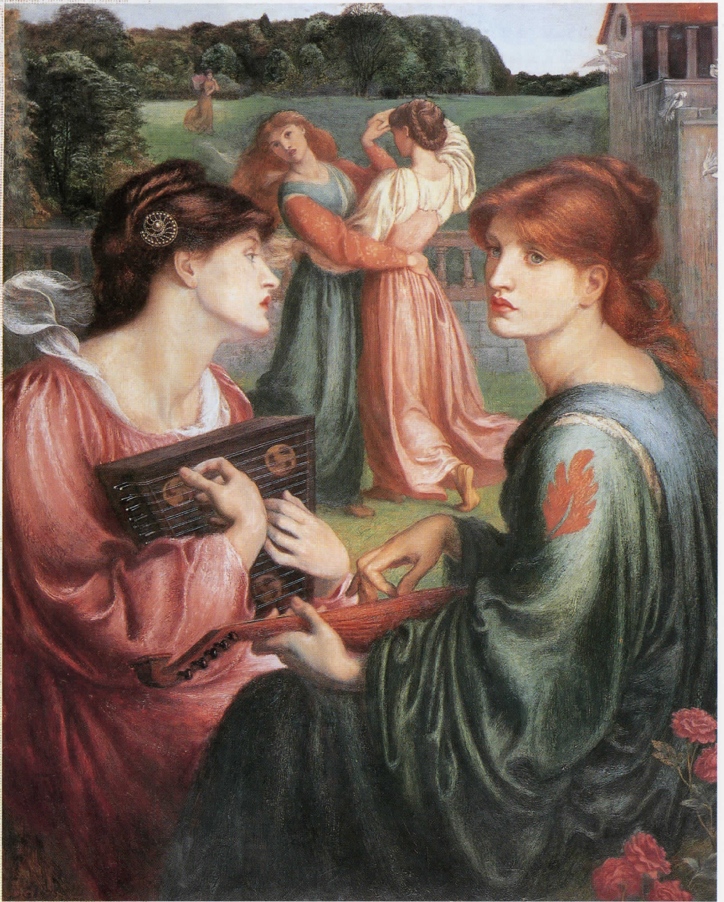
ダンテ・ゲイブリエル・ロセッティ「あずまやのある草地」1850-72年

Masterpieces of the 18th and 19th Centuries' British Paintings from The Manchester City Art Galleries