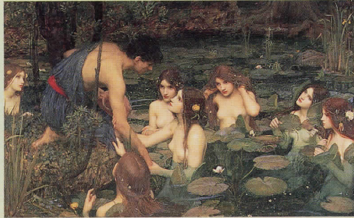
J.W.ウォーターハウス「ヒュラスとニンフたち」1896年