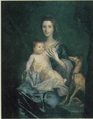
ジョシュア・レイノルズ「ジェーン・ハミルトンと令嬢ジェーンの肖像」1755年