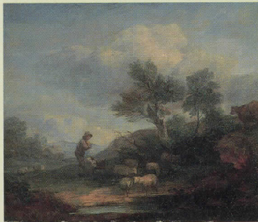
トマス・ゲインズボロ「羊飼いと羊のいる風景」1786年頃