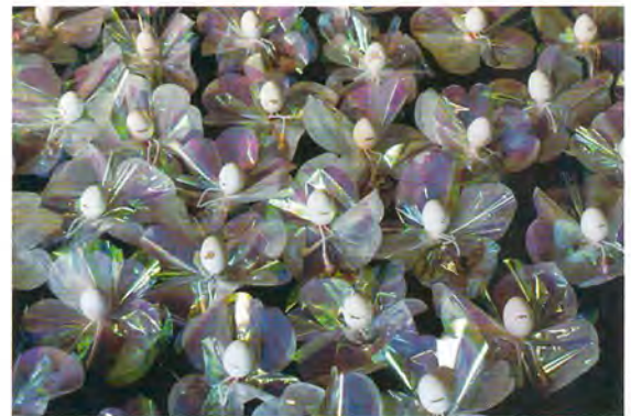
卵霊 tamadama 2012