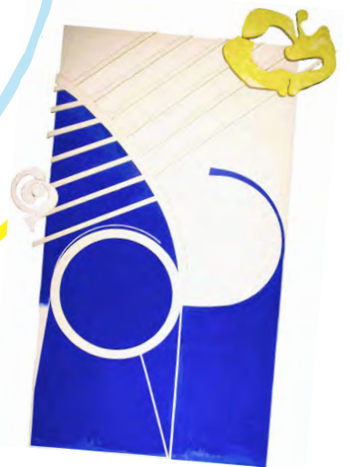
▲川島猛《スペーススイミング》