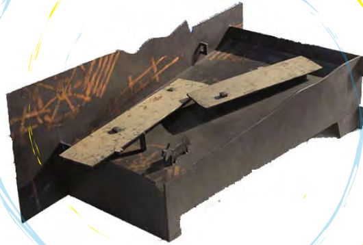
▲山下晴義《春色の径》1995