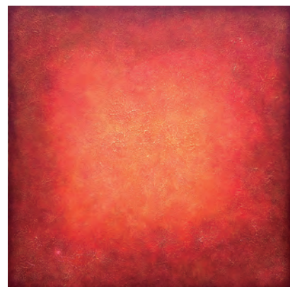
《Return to the Infinite-6》2015