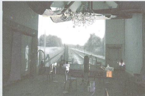
2011-MODERATO-(La loingtaine/Montigny-sur-Loing) ビデオインスタレーション