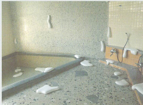
汁/2013/旧坂口屋旅館浴場(岡山)