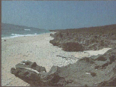
「レフトライトデザイア」2004〜