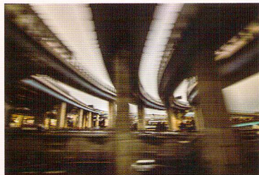
所幸則 <270kmで走る新幹線からみた高速道路>

大画面 84 インチの4Kディスプレイによる作品紹介やトークショーも予定しています。