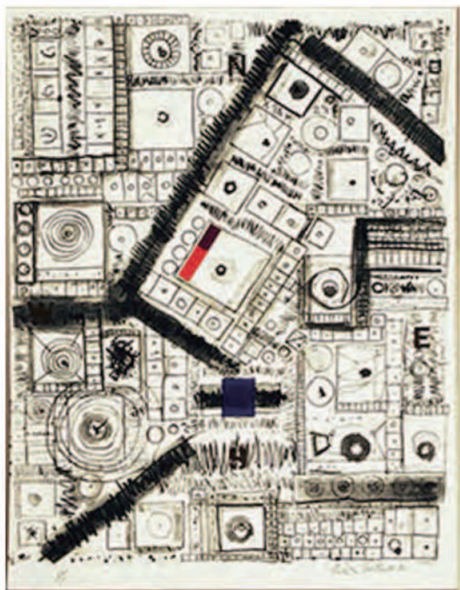
《都市の中の都市》 猪熊弦一郎 1978