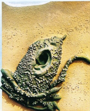
Seaman No.7 (浜辺) / 2004