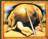
●第6回大賞-"Hito Tunk" 菅内克典