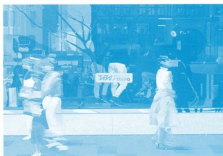
反射率39%重複視-STUDIO- 近藤大志