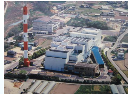
西部クリーンセンター

基幹的設備改良工事 破碎処理施設の大規模改修工事の工期を延長することに伴い、債務負担行為を変更します。