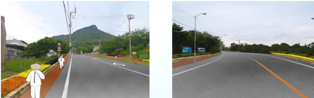
屋島ドライブウェイ市道化工事後イメージ