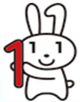
愛称：マイナちゃん