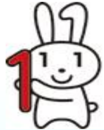
愛称：マイナちゃん