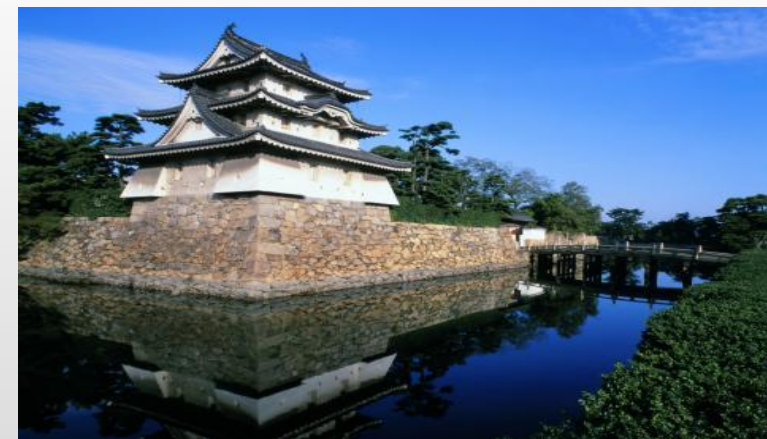
高松城跡（玉藻公園）