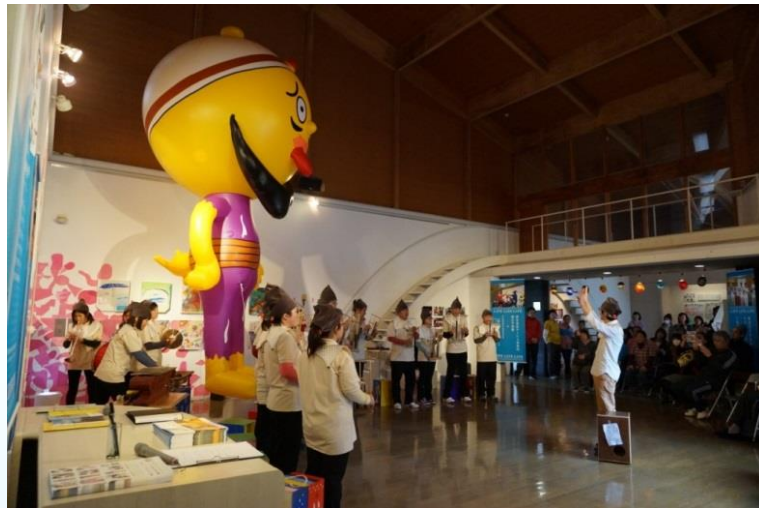
活動報告展の様子