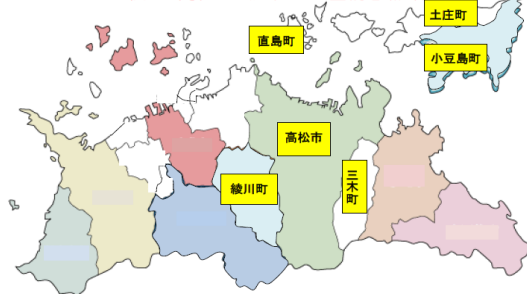
瀬戸・高松広域定住自立圏構想(仮称)

本市と土庄町、小豆島町、三木町、直島町、綾川町の1市5町で構成する瀬戸・高松広域定住自立圏(仮称)構想を実現するため、平成21年度中に協定を締結し、本市の中核拠点性の一層の強化や圏域全体の活性化を図り、魅力ある地域の形成を目指すもの