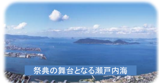
祭典の舞台となる瀬戸内海