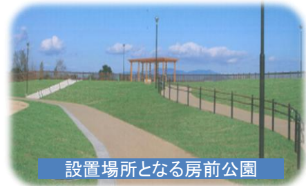
設置場所となる房前公園

若手作家の育成と市民が身近なところで芸術作品に触れる機会を提供するため、全国有数の石材産地である牟礼・庵治地区を中心に、3年に一度石彫コンクールを開催し、優秀作品を選定し、実物制作を行い設置するもの