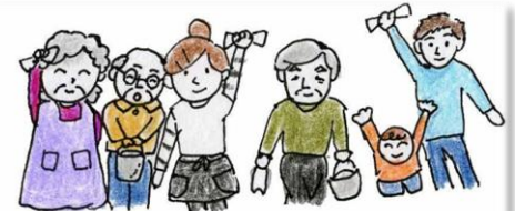
わたしたちのまちはわたしたちの手で!

地域コミュニティ協議会が、地域課題の解決もしくは改善するため行う新規事業のうち、他の模範となるような事業に対し助成(1件当たり50万円が上限)するもの