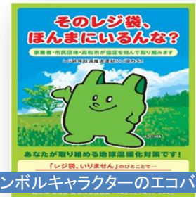
シンボルキャラクターのエコバックン