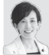
山本 かなえ 現 所属：国土交通省大臣政務官、 参議院議員、 経歴：東京大学大学院工学系研究科、 年齢：54歳 「あなたの声も、かなえるんです。」