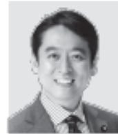
平本 だいさく 現 所属：公明党参議院大臣政務官、 参議院議員、 経歴：東京大学法学部、 年齢：55歳 未来をひらく確かな實力!