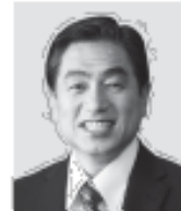
若松 かねしげ 現 所属：公明党大臣、参議院議員、 経歴：千代田大学工学部、公明党執行部、 税理士、行政書士、 年齢：57歳 「最前線」で投票・買収に全力