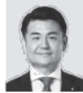
かわの 穂博 現 所属：国土交通省大臣政務官、 参議院議員、 経歴：愛媛県立大学工学部、 年齢：51歳 近い、遠い、届かぬ、 公明党は、参議院選出比例区に上野みかんを以てあけ人を受託しています。(選挙公報) 2019年10月28日現在