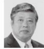
自由民主党公認候補