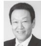
自由民主党公認候補