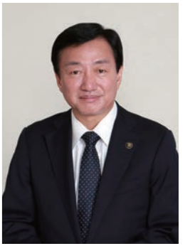
高松市長 大西 裕人