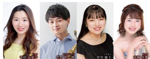
(宇多津町出身) (高松市出身) (高松市出身) (善通寺市出身)