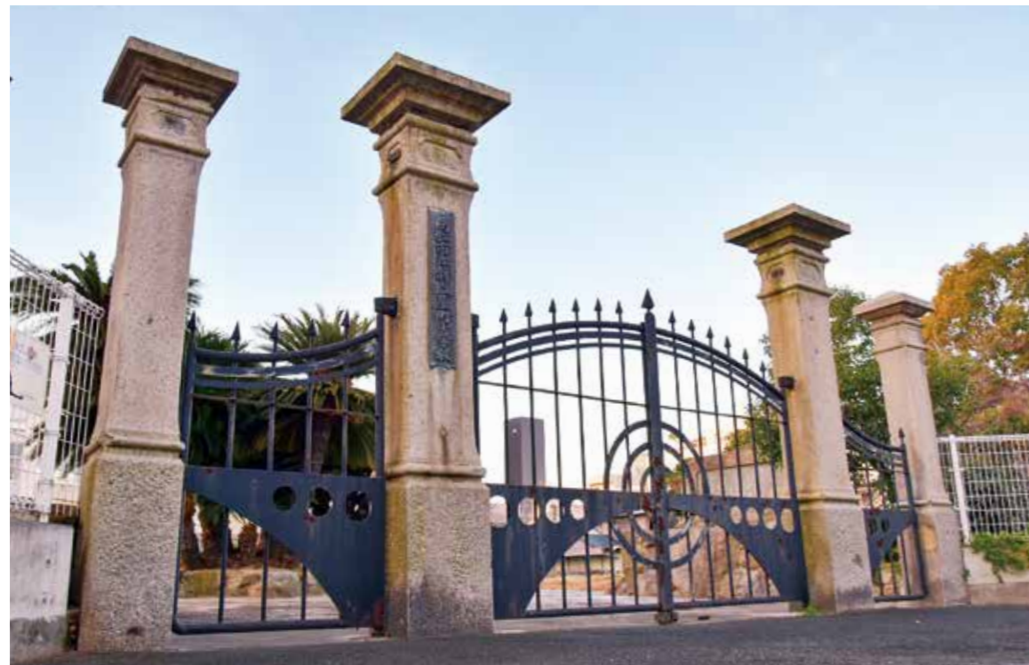
旧新塩屋町小学校門柱 一戦火に耐えた歴史ある門柱をパシャリー

平成22年3月に閉校した新塩屋町小学校の正門として、多くの児童を見守ってきた門柱。市立鶴屋町尋常小学校の校舎建築が始まった明治30年頃に設置された花崗岩製の門柱で、高松大空襲の戦火や長年の風雪にも耐え、多くの児童を見守ってきました。学校の正門としての役割を終えた今も地域のシンボルとして、大切に保存されています。