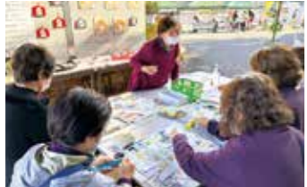
新鮮野菜軽トラ市 in 安原(塩江地区)

高松市では「ほっとけん市民 みんなでつくるほっとかんまち 高松」をスローガンに福祉などの地域生活課題を解決する「地域共生社会の構築」を目指しています。 誰もが幸せに暮らせる社会の実現に向けて、自分ができることは何か、考えてみませんか。