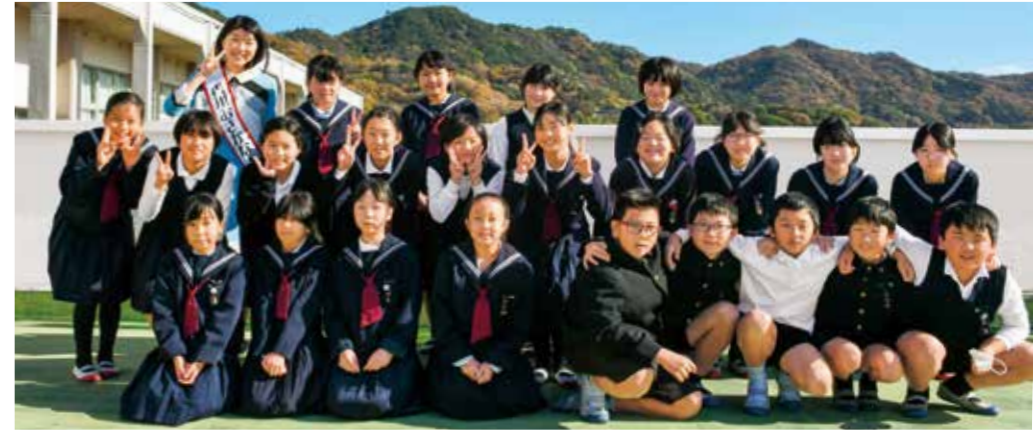
庵治小学校5年生の皆さん

地域のさまざまな活動に情熱を注ぐ子どもたちを紹介する「高松アオハルめぐり」。 今回は「庵治のことが好き」をテーマに庵治町の海や山の幸の恵みを知り、地域への愛着を育む活動を行う庵治小学校5年生の皆さん取材しました。 庵治小学校では、子どもたちに庵治町のすばらしさを知ってもらうため、「あじっこ学習」と呼ばれる総合的な学習の時間を中心に活動を行っています。このうち、5