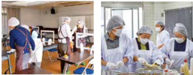
「会食」の準備をしている様子(仏生山地区)