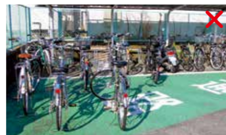
1台の自転車から始まり、次から次へと駐輪マスをはみ出して通路上に駐輪されている

禁止区域だけでなく、公共の場所などに放置されている自転車は撤去します。撤去した自転車の返還を受ける際には、 移送保管料(自転車1,500円、原付自転車2,500円)が必要となります。