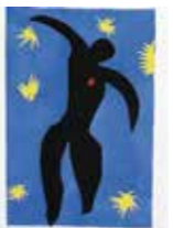
アンリ・マティス (ジャズ)イカロス 1947年、高松市美術館蔵

ピカソやマティス、ダリなどの巨匠たち から現代アーティストのオピーなど20 世紀に活躍した芸術家たちによる作品約 200点を紹介。彼らが絵画表現に挑戦し 続けた軌跡をたどります。講演会やワー クショップの情報はホームページ参照。 📄 800円(大学生500円、高校生以下な ど無料) 🗓 市美術館(☎ 823・1711)へ 📅 月曜