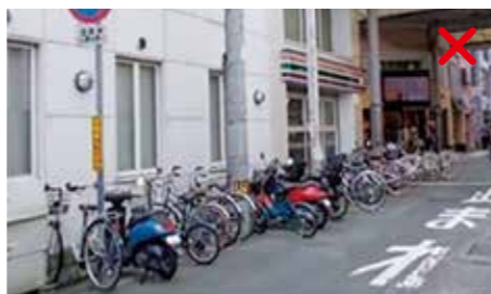
駐輪場ではない路上に長時間停められて、歩行者・自動車の通行を妨げている