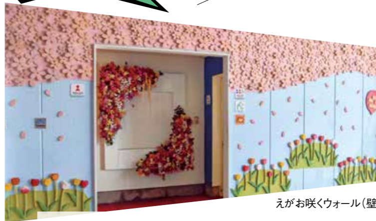
えがお咲くウォール(壁)