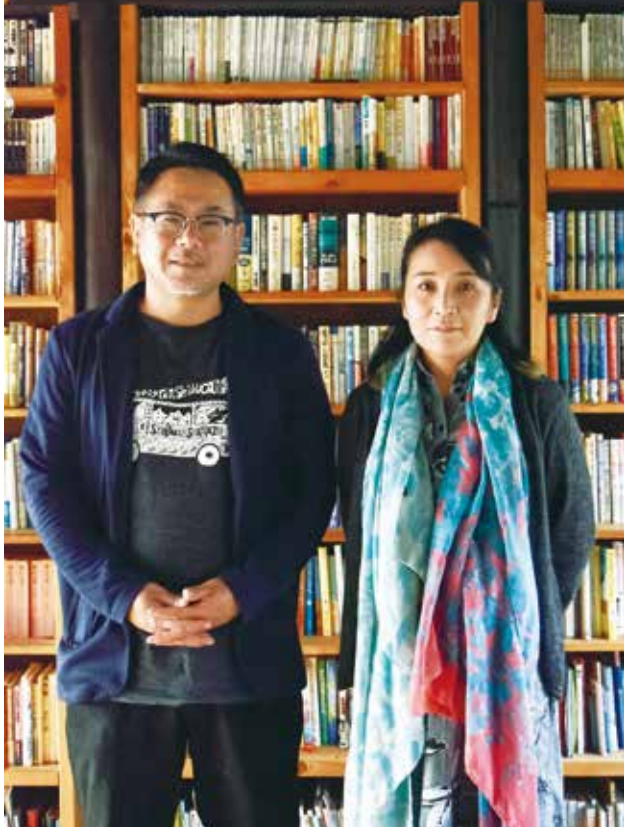
特定非営利活動法人男木島生活研究所 理事長