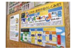
市場のしくみを分かりやすく解説