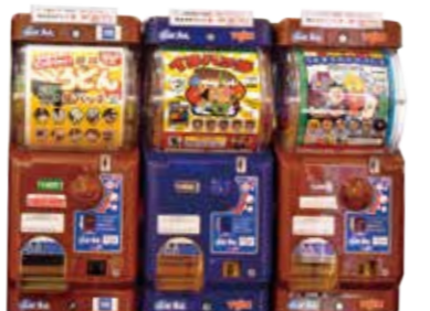
市場でしか買えない限定ガチャも!