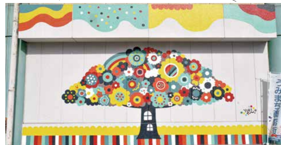
待ち合わせ場所やフオスポットに! 市場の木