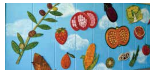
うまいもん壁(ウォール)

▲県立高松 工芸高等学 校の生徒達 によって描 かれた壁面 アートの数 々。中でも 「えがお咲 くウォール (壁)」は、 木材で作ら れた立体的 な桜やチュ リップの花 々が壁面に 咲き誇って います。