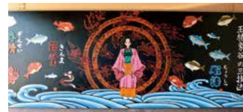
香川に住まう〜いとよ姫と三つの漆技法〜