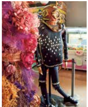
アート作品も展示中