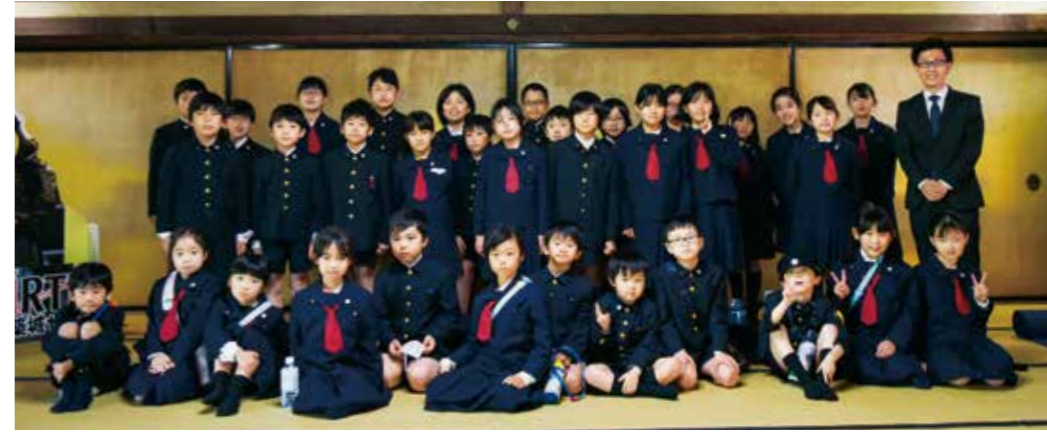
1～6年生の児童34人でつくる「赤4組」の皆さん

地域のさまざまな活動に情熱を注ぐ子どもたちを紹介する「高松アオハルめぐり」。今回は「玉藻公園をPRしよう」をテーマに玉藻公園の魅力や課題の探究に取り組む、香川大学教育学部附属高松小学校「赤4組」の皆さんの活動を取材しました。 これは、附属高松小学校1年生から6年生の赤・白・緑組の子どもたちが、それぞれ6グループに別れて課題に取り組む