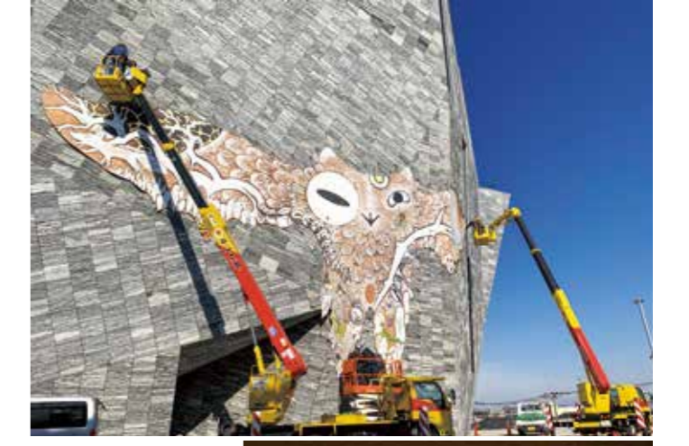
(参考図版)《武蔵野皮トンビ》設置風景 2021 ©2021 Tomoko Konoike Courtesy of Kadokawa Culture Museum ※本展では新作を展示します

🕒7月16日(土)～8月21日(日) ①麦わら編みで、馬やしおり作り体験 ②石臼での麦挽きや天秤棒を使った荷物運び体験 🎫無料 当日に直接、香南歴史民俗郷土館で申し込み。