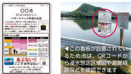
この看板が設置されているため池は、QRコードから浸水想定区域図や避難経路などを確認できます

ため池や用水路などでは、毎年、全国的に痛ましい転落事故などが発生しています。特に、子どもや高齢者は注意が必要です。家庭や地域全体での声かけや見守りをお願いします。