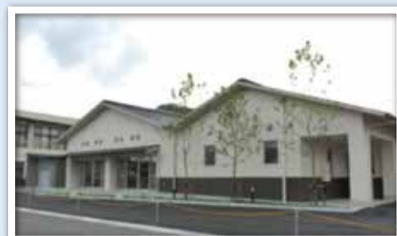
改築したコミュニティセンター