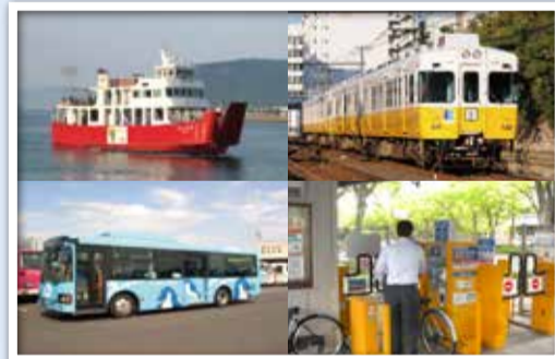
公共交通・自転車を利用したまちづくり