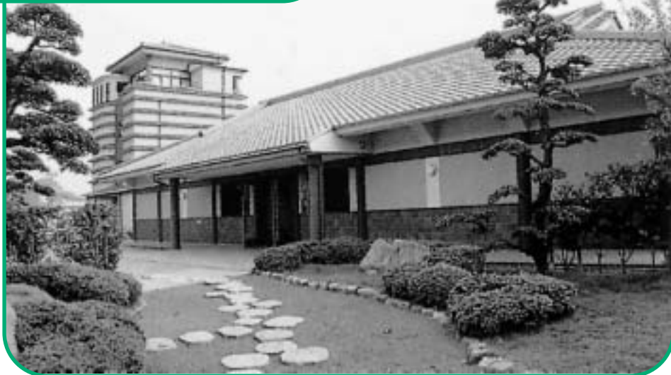
讃岐国分寺跡資料館

「戦後日本の現代美術」「20世紀以降の世界の美術」「香川の美術」の3つのテーマに沿った常設展示のほか、企画展を行っています。