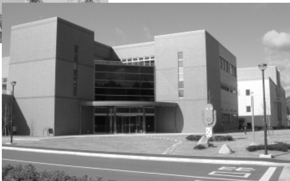
管理棟・エコホテル