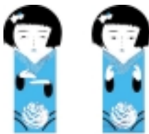
高松市都市イメージキャラクター