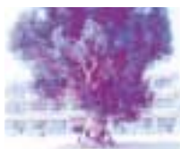
牟礼地区の木「ユーカリ」