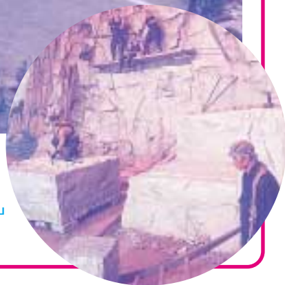
資料館展示 「石切り風景」