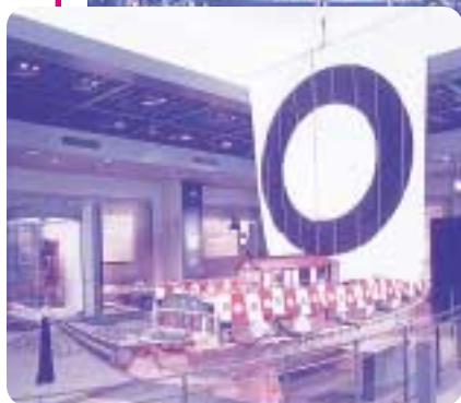
歴史資料館展示 御座船「飛龍丸」