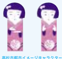
高松市都市イメージキャラクター

編集・発行 / 高松市・牟礼町合併協議会事務局 〒760 - 8571 高松市番町一丁目8番15号 高松市役所6F TEL : 087 - 839 - 2121 FAX : 087 - 839 - 2125 URL : http://www.takamatsu-mure.jp E-mail : m0834@city.takamatsu.lg.jp