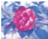
牟礼地区の花「つばき」