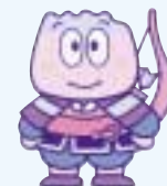
牟礼町イメージキャラクター 与一くん