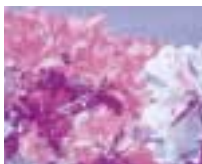
高松市の市花「つつじ」 (さつきを含む)