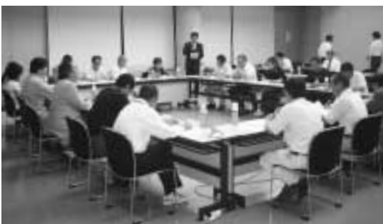
住民懇談会の様子