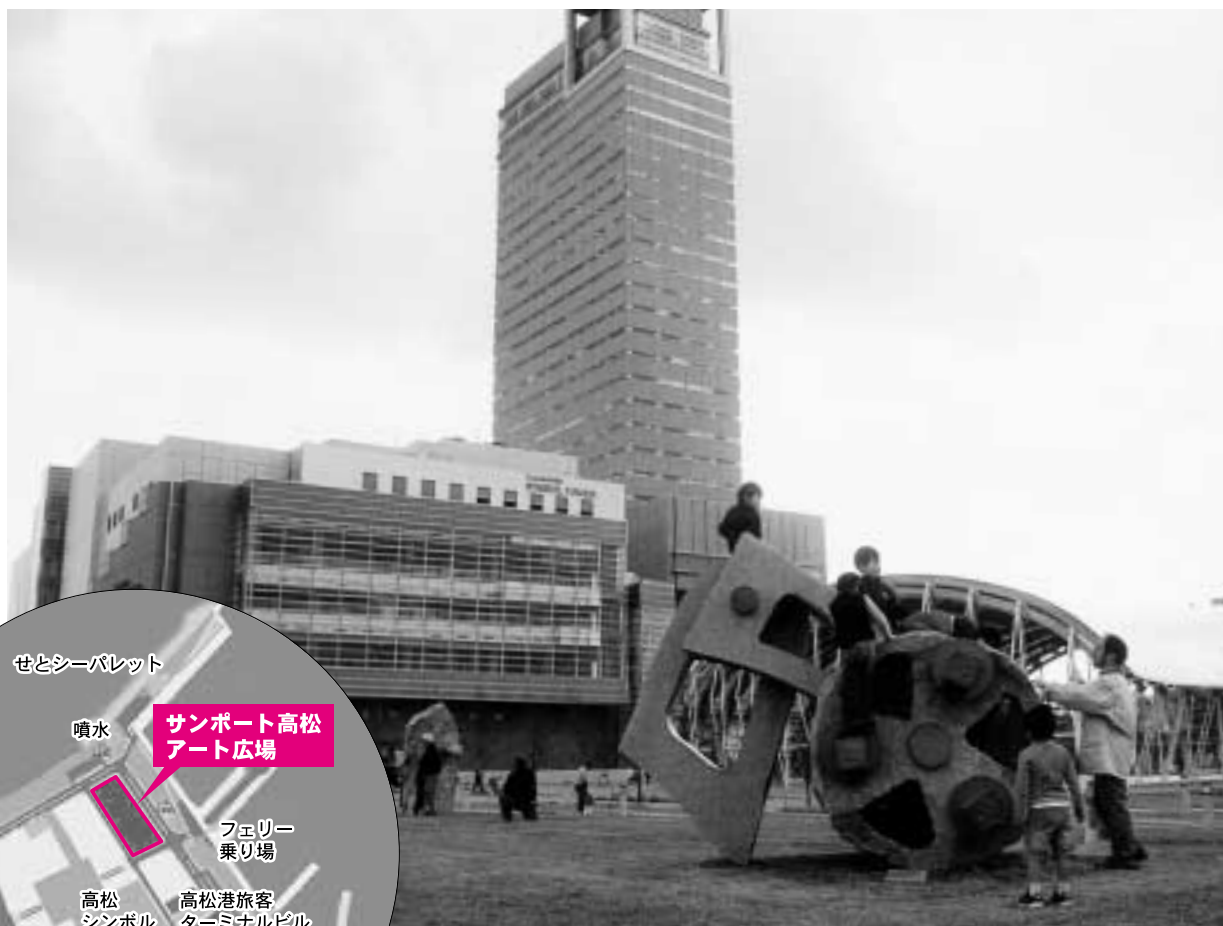
GORORI : 第6回 石のさとフェスティバル 招待作家の作品 (庵治町所有) サンポート高松アート広場