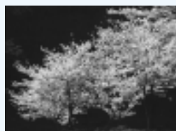
塩江町の木 《やまざくら》