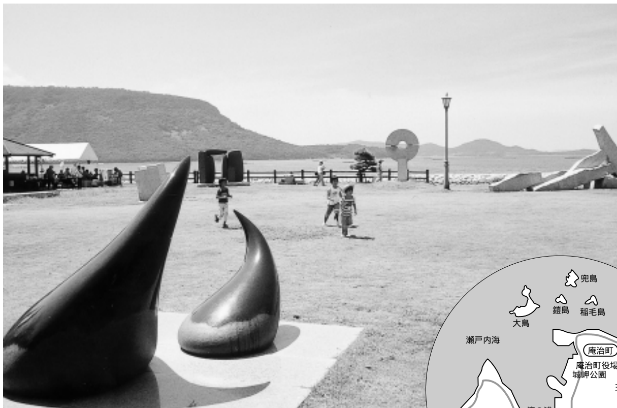
庵治町・城岬（しろばな）公園から見た屋島