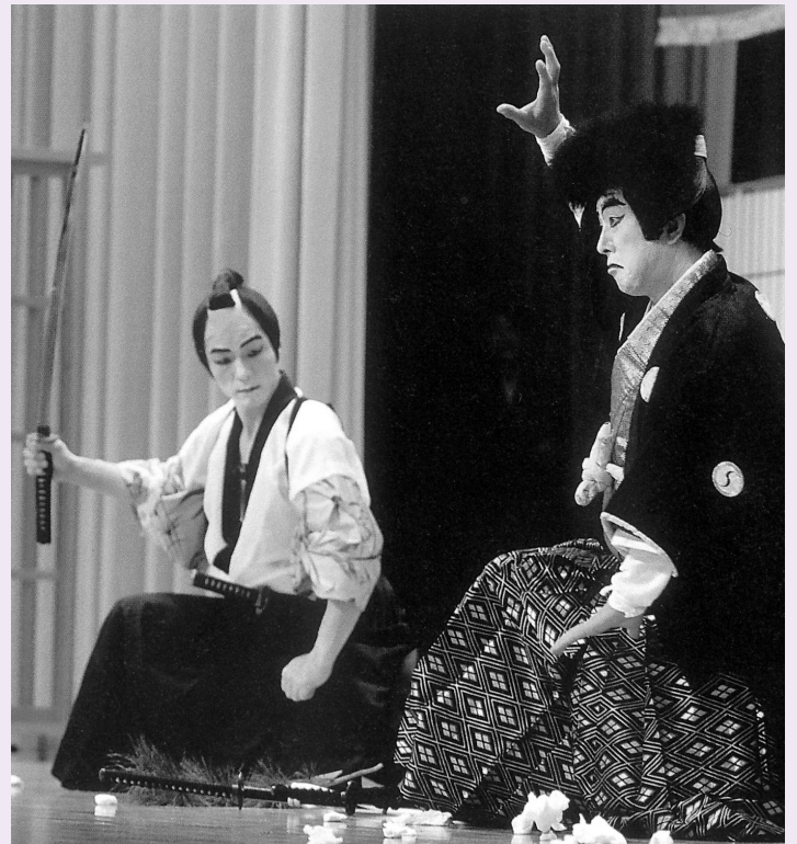
農村歌舞伎 祇園座（香川町）