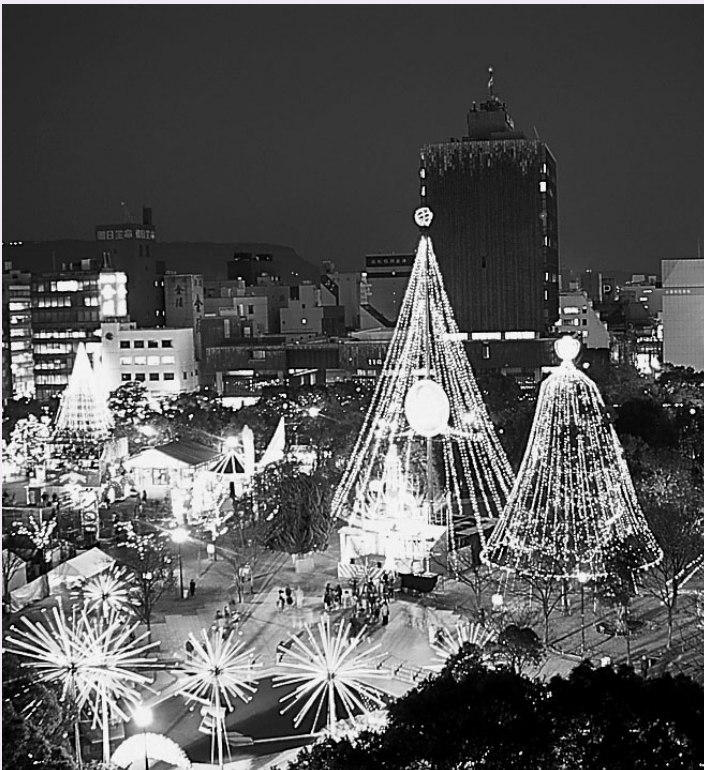
高松冬のまつり（高松市）