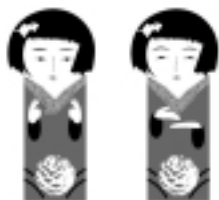
こんにちは ありがとう

合併協議会の第2回会議から第4回会議が 開催され、合併協議にかかる基本項目が承認 されました。