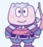
牟礼町キャラクター「与一くん」

編集・発行 / 高松市・牟礼町合併協議会事務局 〒760 - 8571 高松市番町一丁目8番15号 高松市役所6F TEL : 087 - 839 - 2121 FAX : 087 - 839 - 2125