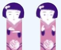
高松市都市イメージキャラクター

編集・発行 / 高松市・牟礼町合併協議会事務局 〒760 - 8571 高松市番町一丁目8番15号 高松市役所6F TEL : 087 - 839 - 2121 FAX : 087 - 839 - 2125