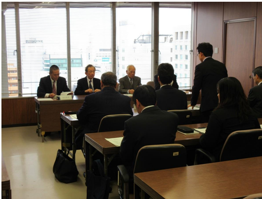
監査委員による事情聴取