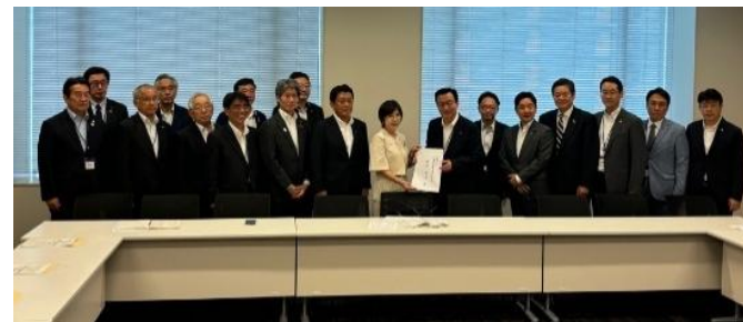
関係国会議員への要望活動の様子