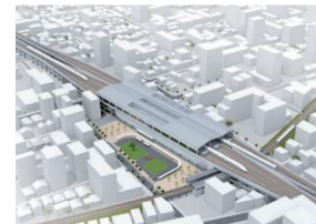
J R 栗林駅付近