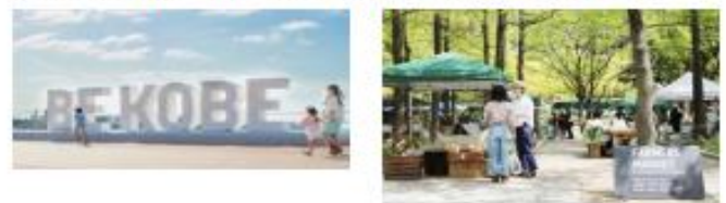
兵庫県神戸市 (2008年、デザイン)