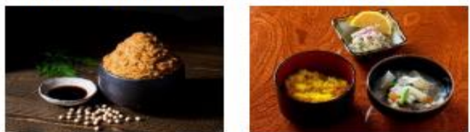
大分県臼杵市 (2021年、食文化)