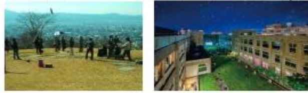
山形県山形市 (2017年、映画)