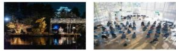
愛知県名古屋市 (2008年、デザイン)