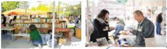
岡山県岡山市 (2023年、文学)