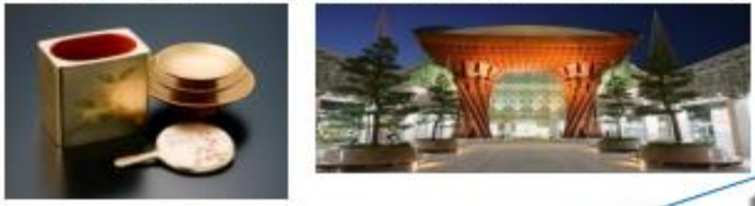
石川県金沢市 (2009年、クラフト&フォークアート)