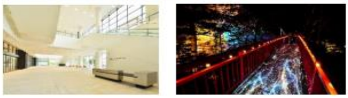
北海道札幌市 (2013年、メディアアート)