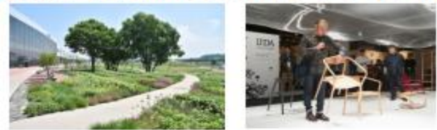
北海道旭川市 (2019年、デザイン)