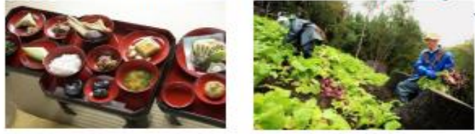
山形県鶴岡市 (2014年、食文化)