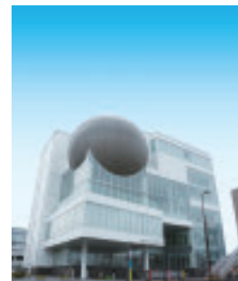
たかまつミライエ

〒760-0068 高松市松島町一丁目15番1号 たかまつミライエ5階 TEL(087)833-2211/FAX(087)833-2244