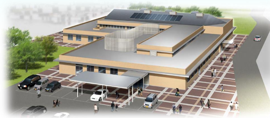
東部南総合センター（仮称）イメージ （山田地区）

市民ニーズに的確に対応するため、高松市地域行政組織再編計画に基づき、総合センター等を整備します。