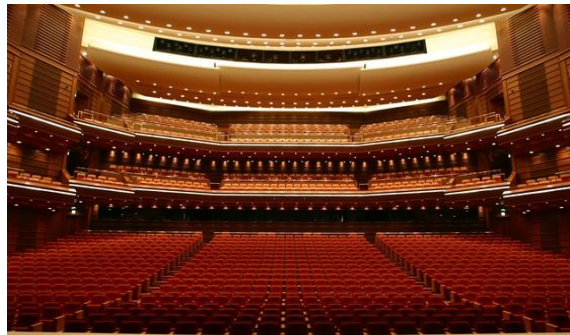
<サンポートホール高松 大ホール>

高松市文化芸術ホールの耐震化と老朽化した設備の更新のため、大規模改修工事を実施します。