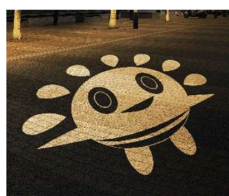
● 3か所の影絵アイコンを投影(サンポート高松ならではの歩く楽しみの仕掛け)