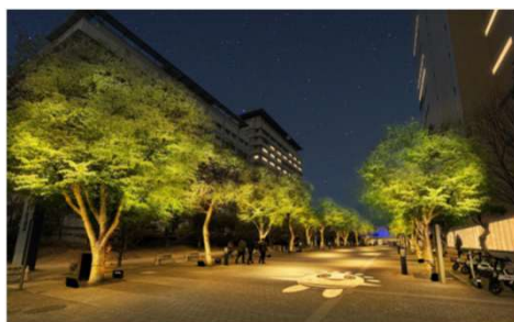
● 通常は電球色で街路樹をライトアップ