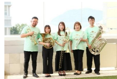
さぬき真鍮管研究所