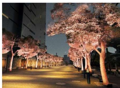
● 特別日には、イベントのテーマに合わせたカラーライトアップ