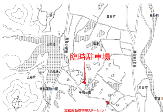
【 附近見取図 】

当日は、敷地内の駐車場は使用できません。 市道横の敷地内スペース、又は、平和公園内の臨時駐車場を御利用ください。