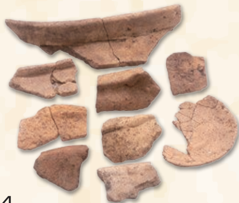
勝賀城跡から出土した土器