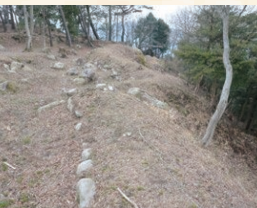
折れまがった土塁