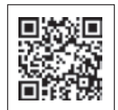
▲お申し込みフォーム

右記のQRコードを読み込み、受付フォームからお申込みください。申込みが完了しましたら、受付番号記載の送信完了画面を保存し、当日受付で御提示ください。